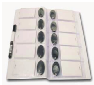
Pärm med passerbrickor/kort