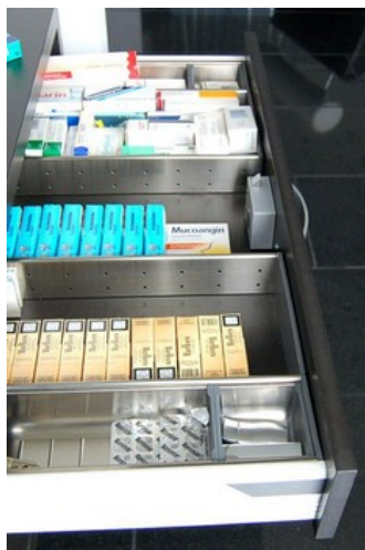
Apotek och kiosker